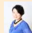
青山オヤコサロン ボヌールド サクラ グラン・ジュテ.llc 代表

都心住まいのママたちは、子育てにも一生懸命です。一方で、自分たちの心地よさにもとても敏感。お金のかけ方が、モノからコトに変化している今であっても、心地よいモノは確実に手に取る。そんな人たちです。自身がよいと思ったものはブログなどで必ず発信し、いいと思っている人の紹介したモノは試すだけのアクティブさも持ち合わせています。法人会員さまには、ボヌールド サクラをそんなママたちとの交流の場としてご提供いたします。マーケティングの場、あるいは、サクラの場をそのまま企業のCSRの場としてご利用いただくことも可能です。御社の“ママにやさしい企業”を、サクラのノウハウとリテラシーで全面的にサポートいたします。